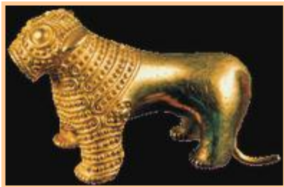
Goldene Löwe 3000 J. v. Ch.